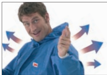
Komplett atmungsaktiv für angenehmen Tragekomfort.

Über Feuerschutzkleidung getragen, fungiert das Modell 4530 bereits als erste Flammenschicht. Leichte Chemikalienspitzer und Stäube können ihm nichts anhaben. Überzeugen Sie sich von 3M™ Schutzanzügen im Einsatz