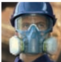
Gase & Dämpfemasken