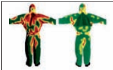
Thermographische Aufnahme (nach 15 Minuten Aktivität): Ohne atmungsaktives Material Mit atmungsaktivem Material