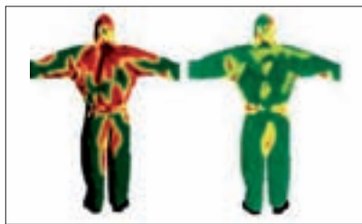
Thermographische Aufnahme (nach 15 Minuten Aktivität): Ohne atmungsaktives Material Mit atmungsaktivem Material