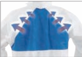
Der atmungsaktive Rückeneinsatz sorgt für verbesserte Luftzirkulation und reduzierten Hitzestau.

Durch die Kombination moderner Materialien verbindet dieser Schutzanzug umfassenden Schutz und optimalen Tragekomfort. Hochwertige, mikroporös beschichtete Fasern schützen den Anwender vor flüssigen Chemikalienspritzern und Partikeln. Selbst bei radioaktiv kontaminierten Partikeln bietet er Schutz. Das atmungsaktive Material im Rückenbereich sorgt für verbesserte Luftzirkulation und macht das Arbeiten auch unter extremen Bedingungen leichter. Verstärkte Nähte erhöhen die Lebensdauer und der praxisgerechte Schnitt schafft Bewegungsfreiheit. Was will man mehr? Testen Sie selbst!